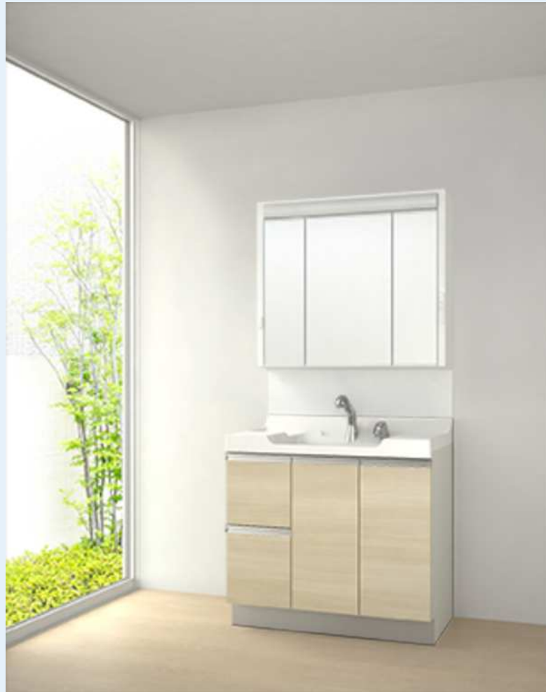
画像はイメージです。実際の仕様とは若干異なる場合があります。