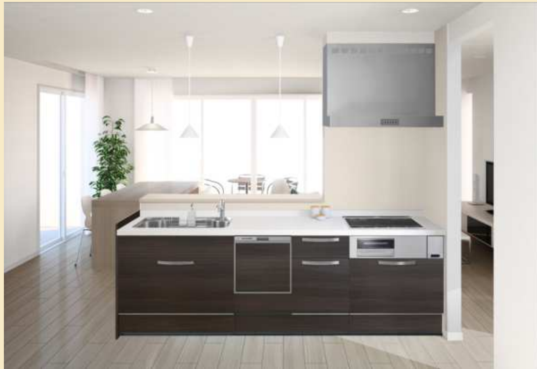
画像はイメージです。実際の仕様とは若干異なる場合があります。